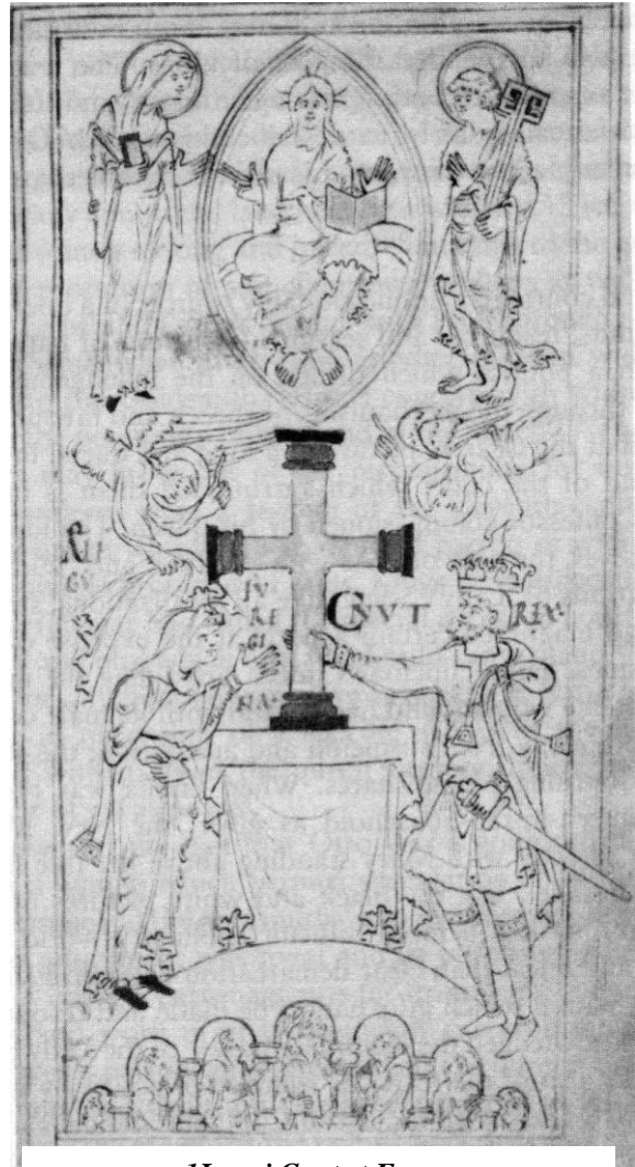
1 Le roi Cnut et Emma Extrait de Liber Vitae de Hyde Abbey

Après leurs pillages, les vikings de Svein à la barbe fourchue, roi du Danemark, viennent se réfugier dans le port de Fécamp, ce qui ne plaît pas du tout au roi d'Angleterre Ethelred the Unready, Ethelred l'immature ou le malavisé. Ce roi anglais fait tout pour empêcher le ravage des côtes d'Angleterre. Ethelred est rarement vainqueur des batailles et préfère donner une rançon de plus en plus élevée pour se débarrasser de ces vikings qui promettent à chaque fois de mettre terme à leurs pillages.