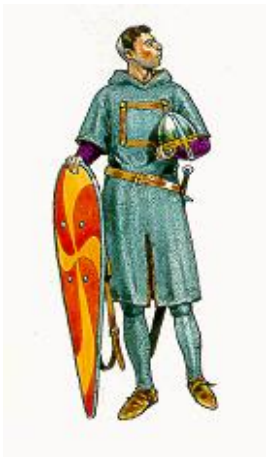
Guillaume le Conquérant

Le Duc, conscient de la force de l'adversaire, se résout à solliciter son suzerain Henri 1 er , roi de France. Le Roi paraît peu surpris de la demande de son vassal et se réjouit, d'autant qu'il a toujours des vues sur la Normandie. Guy de Brionne n'est autre que le fils de Renaud de Bourgogne : les deux territoires de Bourgogne et Normandie réunis pourraient être un jour rattachés à son propre royaume.