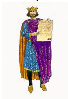
Jean sans Terre

Aussitôt, Jean part en guerre contre cette famille. Le duc de Lésignan est accueilli par le roi de France, qui cite Jean à comparaître à la cour de France en 1201.