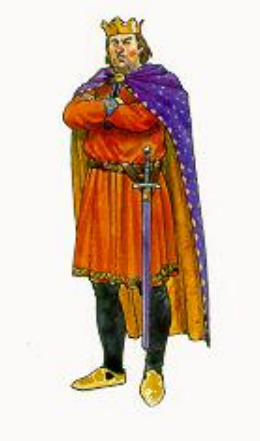
Henry Ier Beauclerc

Devant cette déclaration, Henry, devenu Roi d'Angleterre, occupe Gisors sur Epte. Pendant une douzaine d'années, ce sera la guerre dite des deux Guillaume, Guillaume Cliton et Guillaume Adelin.