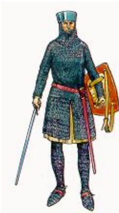
Etienne de Blois

Mathilde n'est pas femme à se laisser évincer. Dure et autoritaire, elle est aidée par son demi-frère, Robert de Gloucester, tout d'abord favorable à Etienne de Blois. Robert est sensible aux arguments de Mathilde de respecter les serments prêtés par leur père. Mathilde n'ignore pas que Robert est très riche, et possède de nombreux ports en Basse Normandie face à l'Angleterre.