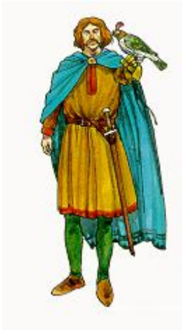
Guillaume le Roux

Le 1er Août 1100, pendant une partie de chasse dans la New Forest, le Roi Guillaume le Roux est blessé par une flèche et meurt le lendemain. Cette flèche tirée par Gaultier Tyrel aurait ricoché sur le dos d'un sanglier. Henri Beauclerc qui était invité à cette chasse, se précipite vers Winchester, et en temps qu'héritier légitime, se fait élire Roi le 3 Août.