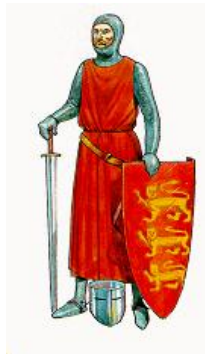
Richard Cœur de Lion

Le roi Richard, bien que né à Oxford en 1157, est le plus français des rois d'Angleterre. Il parle mal la langue et connaît peu les coutumes anglaises.