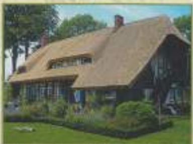
Maison récemment restaurée en roseau de Pologne (chemin de la Hâze, 2012)