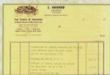
Érêt de facture d'un chaumier local (Léonce Houard, La Cerlangue, 1983)