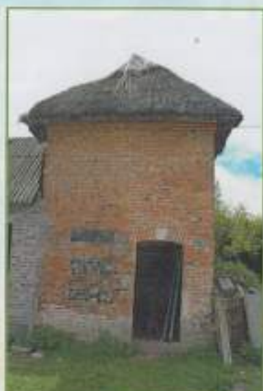
Colombier carré avec couverture en chaume (Saint-Jean d'Abbeville, 2009)