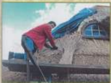
Pose du roseau suivant la méthode hollandaise (chemin des Amoureux, 2012)