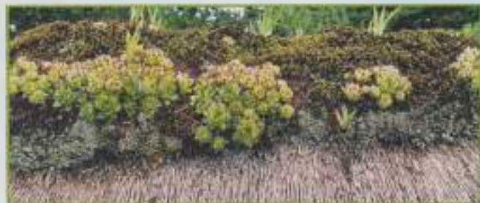
Faîtière de chaumière avec iris et jubarbe (Pays de Caux, 2003)

Pour la quatrième année consécutive, nous vous présentons un aspect de notre commune.