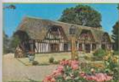
La chaumière de la Bergerie (carte postale moderne, éditeur Yvan, années 1980)