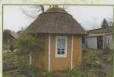
Kiasqué avec couverture en chaume (Le Ferge, 2009)