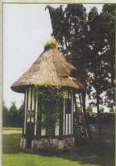
Colombier octogonal avec couverture en chaume (La Bergerie, 2000)