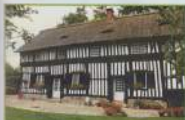
Chaumière du 16ème siècle avec étages en saerrait (rue du four à choux, 1999)