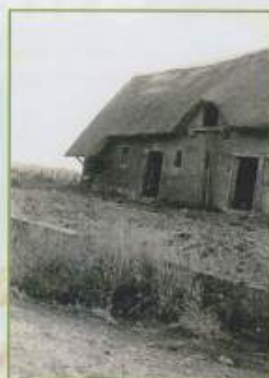
Écuries, ferme Rooquigny (à Mare des Chaudières, 1973)