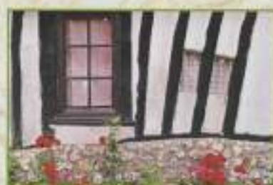
Verrines, chaumière du simoisier (Pays de Ceux, 2000)