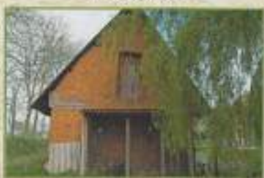
Pignon à redents (Le Bocquetel, 2009)