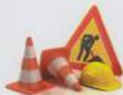
Carrefour rue du four à chaux