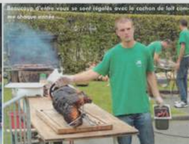
Beaucoup d'entre vous se sont régales avec le cochon de lait comme chaque année.