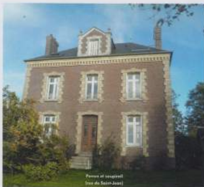
Façade et lucarne (rue de Saint-Jean)