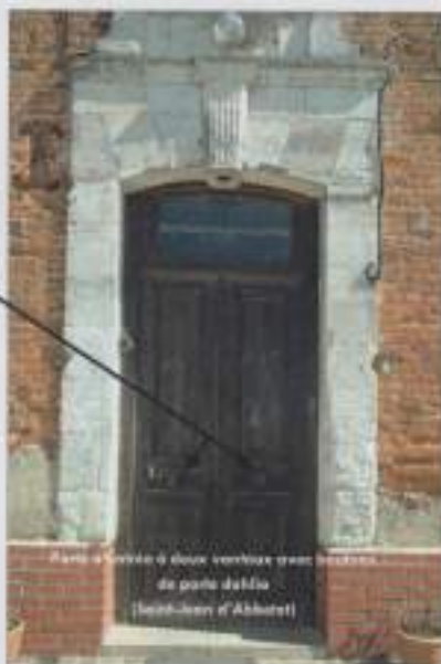
Porte à double vantelle avec bouton de porte de maître (rue Saint-Jean d'Abbeville)