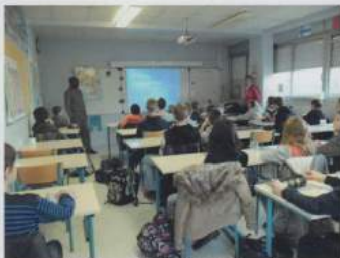
Intervention au collège de Saint Romain - 15 novembre