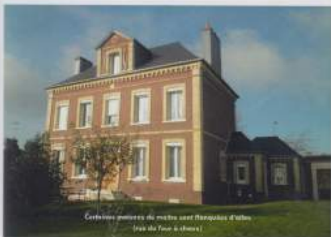
Certains éléments de maître sont flanqués d'édifices (rue de l'Église à Chéris)

Si dans un village la maison de maître est le logis de l'agriculteur en activité au cœur d'une ferme d'une certaine importance, elle devient dans le centre bourg la grande habitation du riche rentier (fermier, négociant, maquignon, etc.) mais aussi du notable (notaire, médecin, etc.).