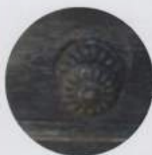
Boutons de porte de maître

Si dans un village la maison de maître est le logis de l'agriculteur en activité au cœur d'une ferme d'une certaine importance, elle devient dans le centre bourg la grande habitation du riche rentier (fermier, négociant, maquignon, etc.) mais aussi du notable (notaire, médecin, etc.).