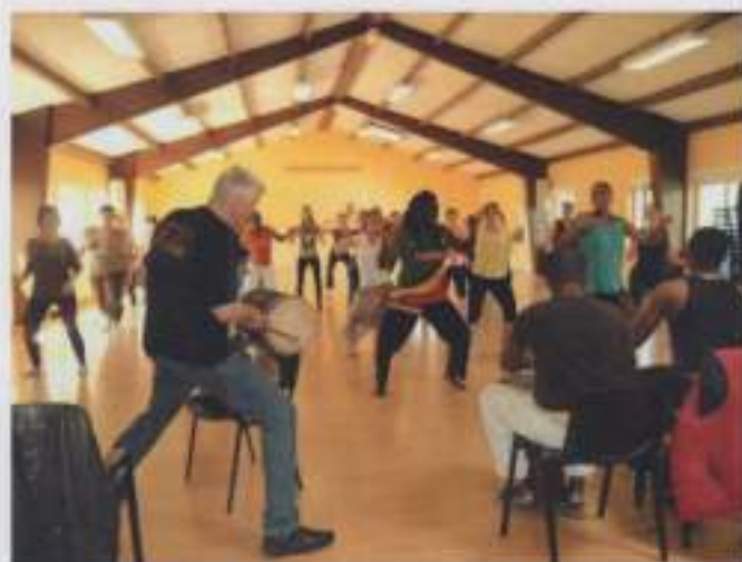
Stage de danse africaine le 1er juin