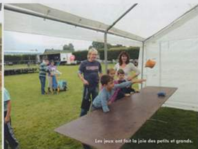
Les jeux ont fait la joie des petits et grands.

La journée a débuté par le départ d'un parcours du souffle organisé par un club de coureurs qui ont rellé toutes les virades de la région au départ de La Cerlangue pour arriver sur la plage du Havre dans l'après midi. Dans la salle polyvalente, différents stands étaient proposés : un vide grenier, les amis de Goma, une vente de linge de maison, un stand de réflexologie plantaire et surtout notre stand associatif d'information de sensibilisation sur la mucoviscidose.