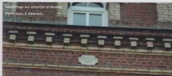
Corbeau sur corniche et fenêtre (rue Saint-Jean d'Abbeville)