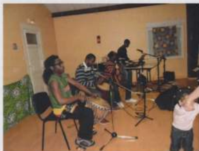
Repas solidaire du 9 mars

Voici une mosaïque de photos donnant des extraits de ces moments importants, tant pour l'association que ses bénéficiaires :