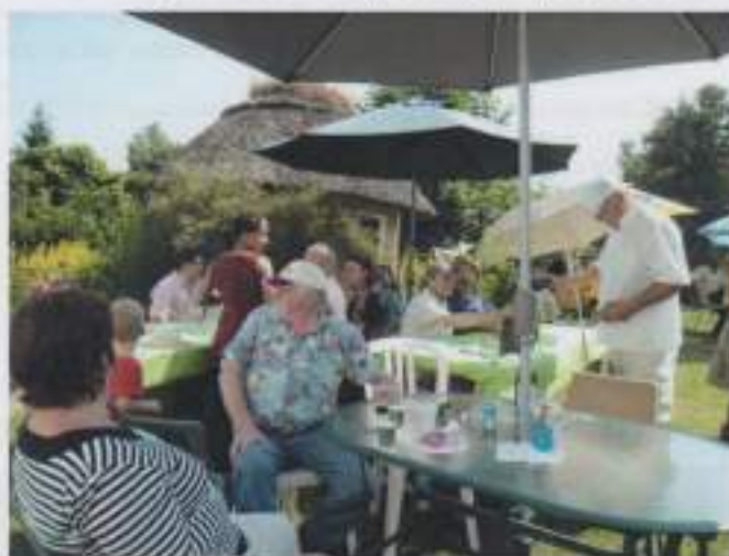
Barbecue solidaire du 17 juillet