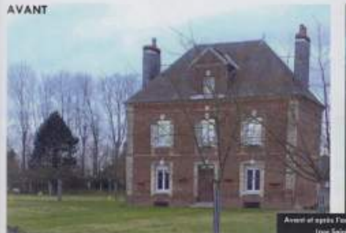
Avant et après l'adjonction d'édifices (rue Saint-Jean)

Il tire donc certains caractéristiques des maisons qu'on ne pouvait appeler à l'époque de « maisons de maître », mais aussi, au contraire, aussi pour Guy de Meuseux, maître l'architecture à un certain maître l'architecture de Meuseux, dans la partie plus ou moins à l'ouest (par exemple comme Maître Chant, notamment à Épreville dans la Part Fille).