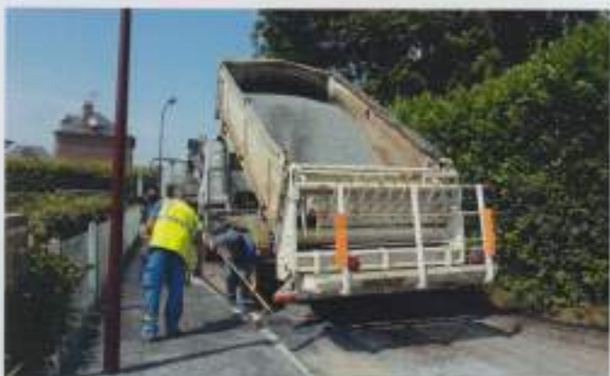
Rue Abbé Cochet

Mon souhait est de poursuivre le programme des travaux ainsi commencés, qui, par leur coût et leur ampleur, doivent s'étaler sur plusieurs années.