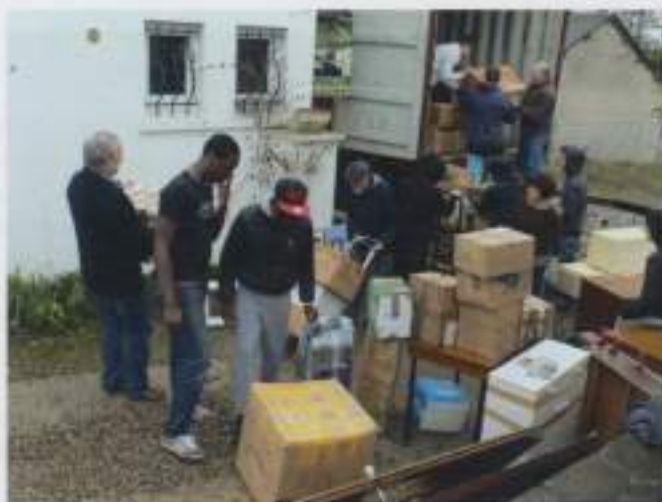
11 avril - Chargement du container le qui a été réceptionné plus tard à Goma.