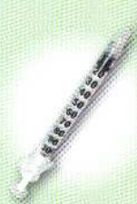
Seringues avec aiguilles serties